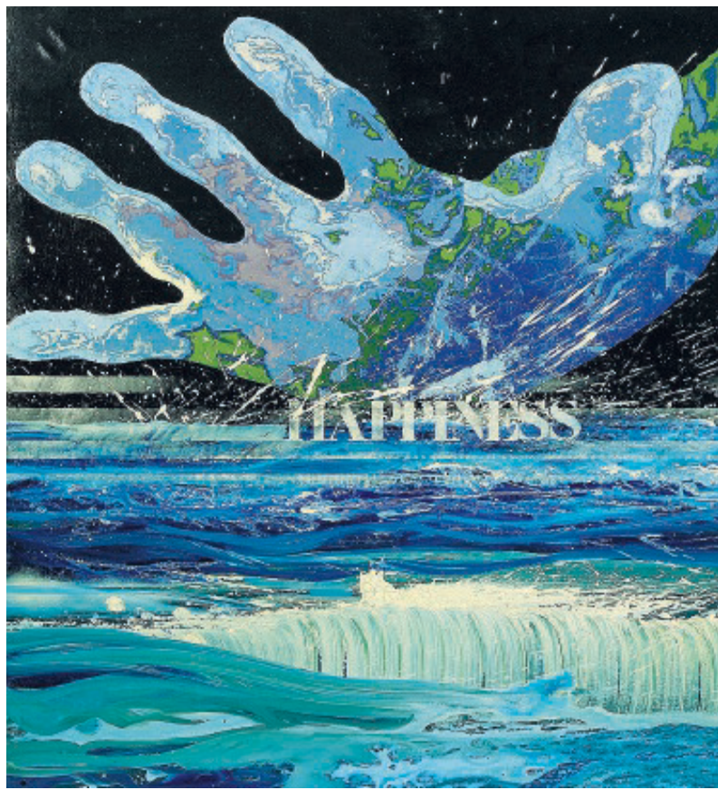
Paolo Baratella «Vieni signora Felicità», 1970.

La mostra offre un gruppo di autori, operanti tra Milano e Roma, mettendo a confronto da un lato espressioni quali la pittura e l'arte concettuale e comportamentale e dall'altro l'illustrazione di riviste e di fanzine, come «ReNudo», che